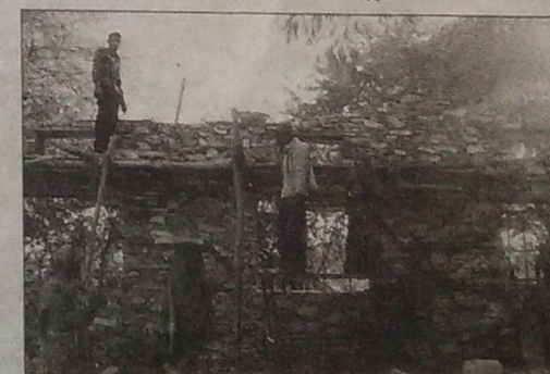
Жители колледжа своими силами с помощью простейших инструментов строят новые корпуса