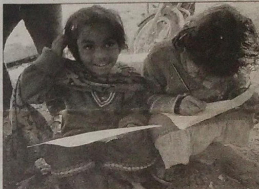
Для многих детей стран третьего мира такие «босоногие» колледжи и благотворительные проекты — единственная возможность получить хоть какое-то образование